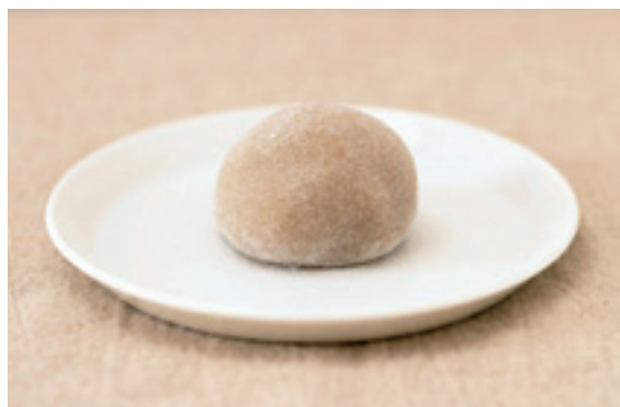
店主おすすめの「そばもち」180円

クローズアップしもうでは毎月、町内の企業を紹介しています。内容は各企業から提出いただいた原稿を基に掲載しています。掲載を希望する企業は下諏訪町 総務課 情報防災係（電話27-1111 内線261）までご連絡ください。